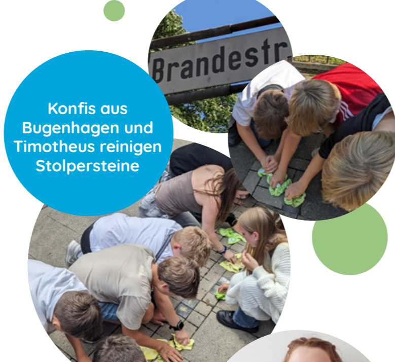
Konfis aus Bugenhagen und Timotheus reinigen Stolpersteine